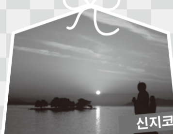
신지코 호수의 석양